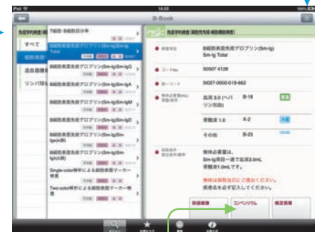
分類別検索→詳細画面