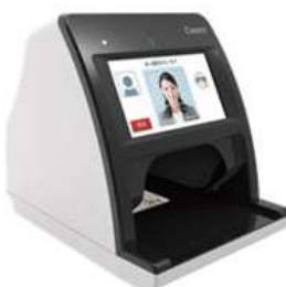
富士通 Japan 株式会社