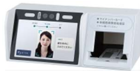
株式会社アルメックス