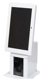
アトラス情報 サービス株式会社