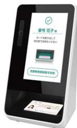
パナソニックコネクト 株式会社